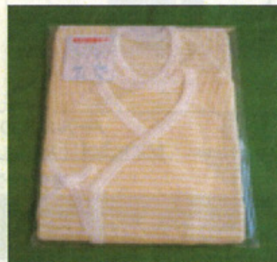
短肌着×1枚 身長50cm コンビ肌着1枚 身長50~60cm クリーム色のボーダー柄で男女どちらもお召しいただけます